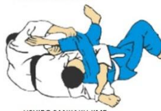
USHIRO SANKAKU JIME